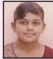
મોમાયા યુક્તા વિરેશભાઈ 8th - 69%

જ્ઞાતિ સમક્ષ અમારી દિકરીઓનું પરિણામ મુક્તા અમે ગર્વ અને હર્ષની લાગણી અનુભવીએ છીએ. અમારી દિકરીઓએ આવું સરસ પરિણામ લાવીને જ્ઞાતિજનોએ એમનામા મુકેલા વિશ્વાસને સાર્થક કરેલ છે. સર્વ દિકરીઓને ખુબ ખુબ અભિનંદન! આવું જ સરસ પરિણામ દરેક વર્ષે લઈ આવી શકે એ માટે શુભ કામના અને જ્ઞાતિજનોનું સુંદર સહયોગ અમને હમેશા મળતો રહે એવી અભિલાષા.